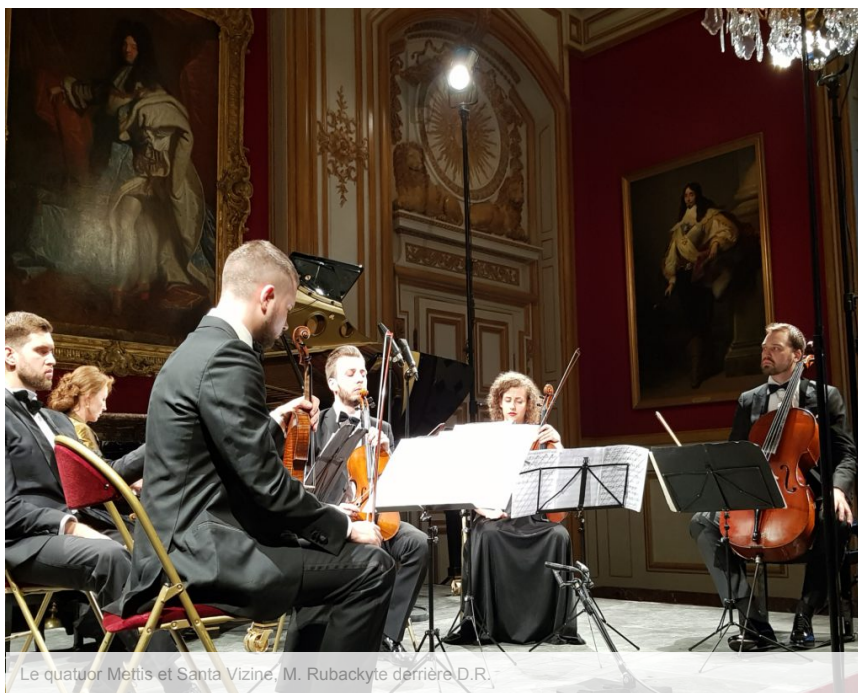
Le quatuor Mettis et Santa Vizine, M. Rubackyte derrière