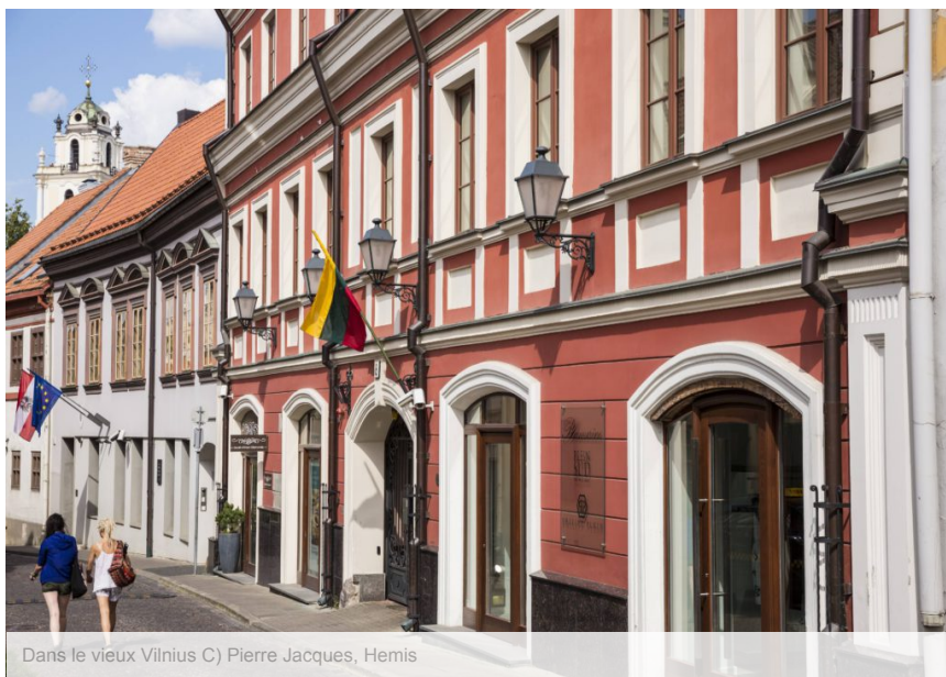
Dans le vieux Vilnius