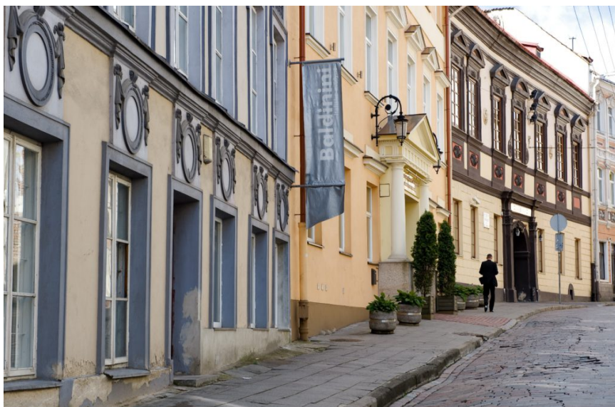
Toujours le vieux Vilnius